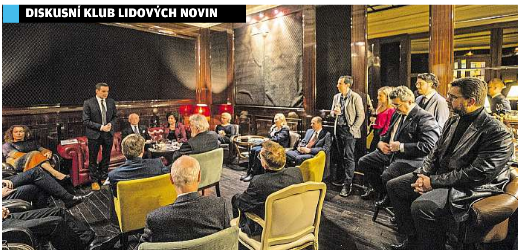
DISKUSNÍ KLUB LIDOVÝCH NOVIN

Pro přetížené insolvenční úseky krajských soudů by navíc příliv desítek (možná až stovek) tisíc nových účastníků oddlužení mohl znamenat další ránu: „Ministerstvo odhaduje počet potenciálních adresátů nové úpravy na 655 tisíc. To je více než dvojnásobek všech insolvenčních řízení, která byla zahájena za posledních deset let! Návrh má potenciál naprosto paralyzovat soudní systém v oblasti insolvenčního řízení.“